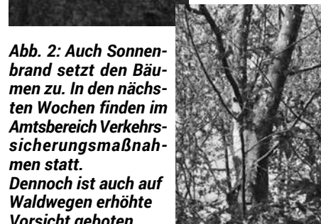
Abb. 2: Auch Sonnenbrand setzt den Bäumen zu. In den nächsten Wochen finden im Amtsbereich Verkehrsicherungsmaßnahmen statt. Dennoch ist auch auf Waldwegen erhöhte Vorsicht geboten.