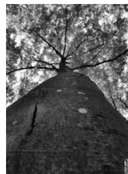
Abb. 1: Astabbrüche können für Waldbesuchende gefährlich werden.

Trockenheit und heiße Temperaturen setzen dem Wald gleich mehrfach zu. Damit die Situation nicht auch für Naturfreunde brenzlich wird, mahnt das AELF zu erhöhter Aufmerksamkeit. Die spontanen Abbrüche der Grünäste seien selbst für Experten nicht vorhersehbar, sagt Nitzl und bittet zugleich um Verständnis für anstehende Verkehrsicherungsmaßnahmen entlang der Waldweg